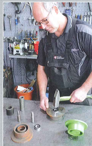
Für diese Tragrollen hat man eigene Gussformen fertigen lassen.

die dann über Antriebs- und Tragrollen durch den Roder laufen. Unterschiedlich sind je nach Erntegut die Stababstände. Auch zusätzliche Gummielemente können den Stäben verschiedene Funktionen zukommen lassen.