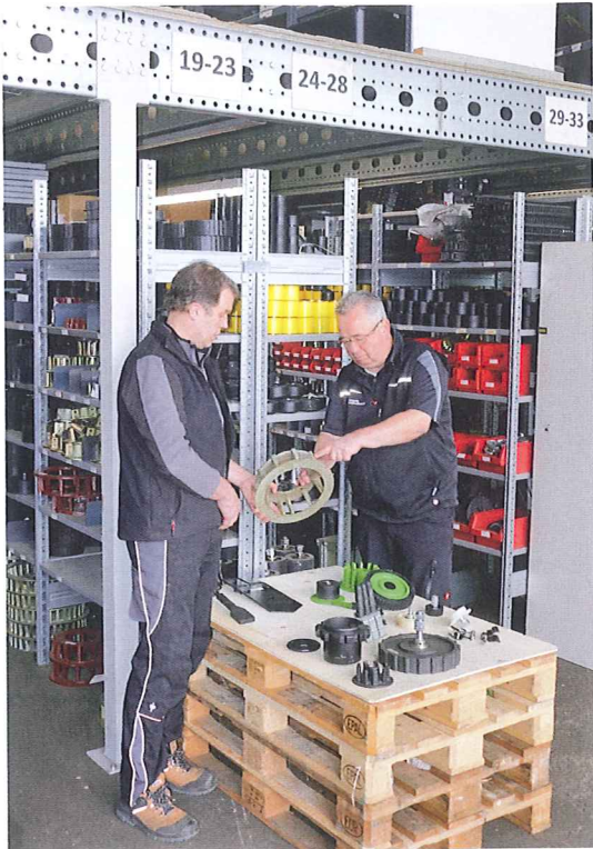
Im Reparaturfall reicht es oft nicht aus, nur ein Siebband zu tauschen. Auch die Tragrollen und Antriebsräder unterliegen hohem Verschleiß.