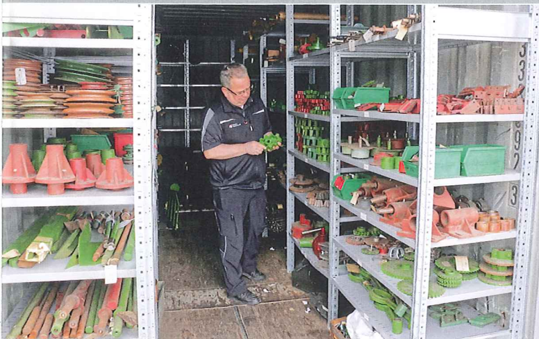
Das Wühlmauslager: In diesem Container lagern zahlreiche Niewöhner-Neuteile, die von verschiedenen Landmaschinenhändlern angekauft wurden.

Die benötigten Bänder können nach Muster oder Maßangaben gefertigt werden. Für die meisten Typen hat man die genauen Daten jedoch in Dateien abgespeichert. Auch auf einen großen Bestand überlagerter Altbestände kann die Hessels