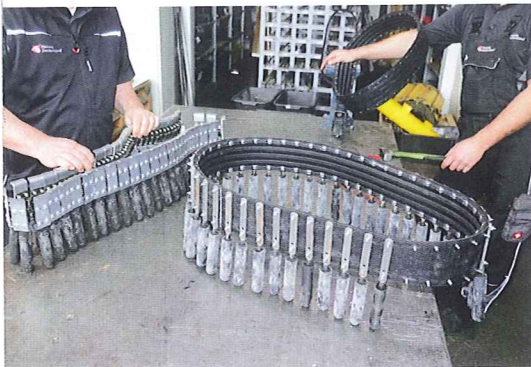
Solche Fingerbänder arbeiten in zahlreichen Rübenrodern. Die Montage aus mehreren Einzelteilen ist zeitaufwändig.