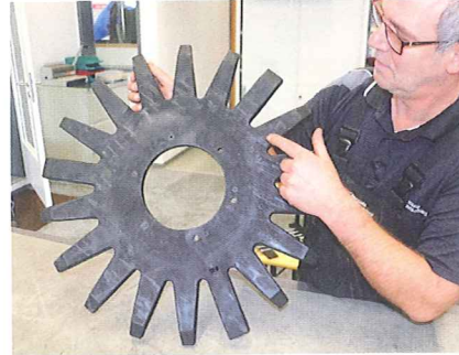
Dieser Stern ist ein typisches Verschleißteil in vielen Rübenrodern. Hessels lässt das Teil aus geeignetem Kunststoff nachfertigen.