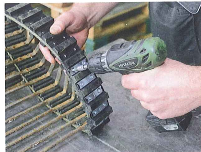
Gerettet wird, was zu retten ist. Wenn es der Verschleißgrad noch zulässt, macht es oft Sinn, ein gerissenes Band zu flicken.