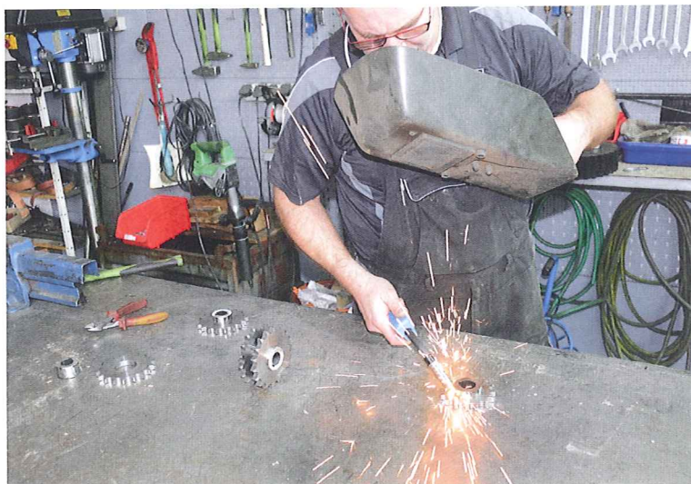
Antriebsritzel für Kettenantriebe unterliegen in den Rodern oft hohem Verschleiß. Auch wenn man es auf den ersten Moment vermuten könnte, handelt es sich dabei nur selten um Standardgrößen. Aus speziell angefertigten Drehteilen werden solche Bauteile nachgefertigt.

quer, und weitere Schäden folgen. Viele solcher Schäden können vor Ort vom Landwirt oder Lohnunternehmer mit geeignetem Reparaturmaterial instand gesetzt werden. Das gilt vor allem für geschraubte und genietete Verbindungen.