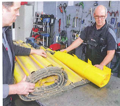
Das noch gut erhaltene Band wird seitlich geöffnet, um die Folie zu tauschen. Ein Spezialbetrieb schweißt passende Planen.